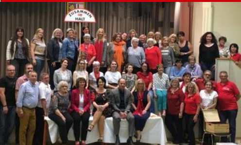
Die SPÖ Bezirksfrauen aus Gänserndorf und Mistelbach