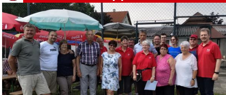
NR Rudolf Plessl zusammen mit unseren Stadt- und Gemeinderäten zu Gast in Gänserndorf Süd

Am 16.6. veranstaltete das Team der Pensionisten Süd wieder den beliebten Frühschoppen im Garten des Volkshauses. Bei gegrillten Spezialitäten, kalten Getränken und musikalischer Untermalung wurde ein unterhaltsamer Vor- und Nachmittag verbracht.