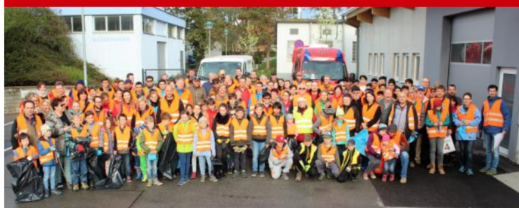
Alle Saubermacherinnen und Saubermacher der diesjährigen Aktion