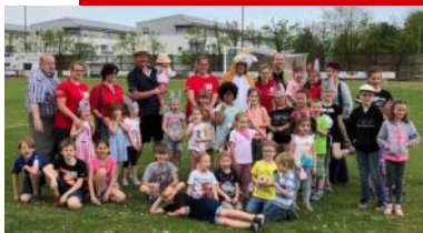
Zahlreiche Kinder beim Osterfest 2019 der Kinderfreunde