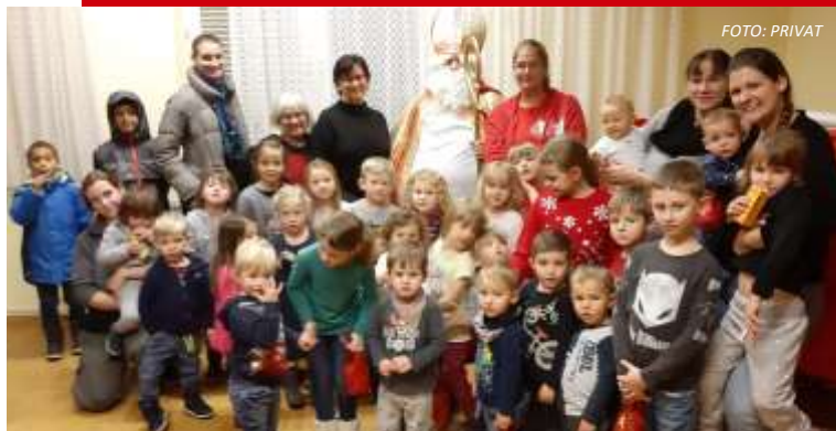
Die Kinderfreunde brachten den Nikolo wieder nach Gänserndorf Stadt und Süd

Am 06.12.2019 war der Nikolaus wieder im Volkshaus in Gänserndorf Stadt zu Besuch. Vorab war der Kasperl zum Lachen und danach der Krampus zum Fürchten. Mit knapp 90 Kindern war die Veranstaltung ein voller Erfolg für Groß und Klein. Das Team der Kinderfreunde verwöhnte die Gäste mit Popcorn, Süßigkeiten, Würsteln und Kuchen. Das ließen sich natürlich auch unsere SPÖ-Mandatare nicht entgehen.