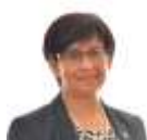
ULRIKE CAP GESUNDHEIT, SPORT U. TOURISMUS